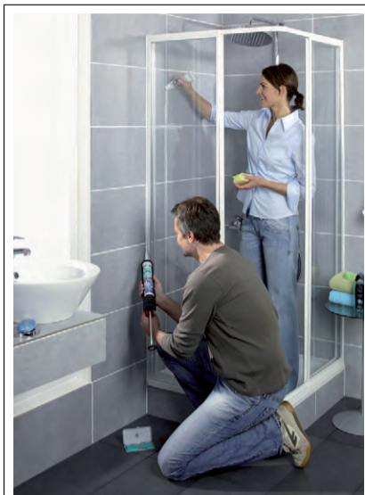
Zementäre Fugen lassen sich reinigen, Silikonfugen müssen bei Schimmelbefall ausgetauscht werden.

■ (akz-o). Bei der Reinigung von Dusche und Co. dürfen die Fugen nicht zu kurz kommen. Dabei gilt: Anschlussfugen brauchen eine andere Behandlung als zementäre Fugen. Worin die Unterschiede liegen und wie die Pflege richtig funktioniert? Ganz einfach: